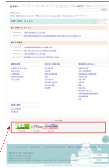
C「防災・くらし・手続き」、D「観光・文化・スポーツ」、 E「産業・経済・ビジネス」、F「市政情報」の 掲載イメージ<赤枠部分>各5枠