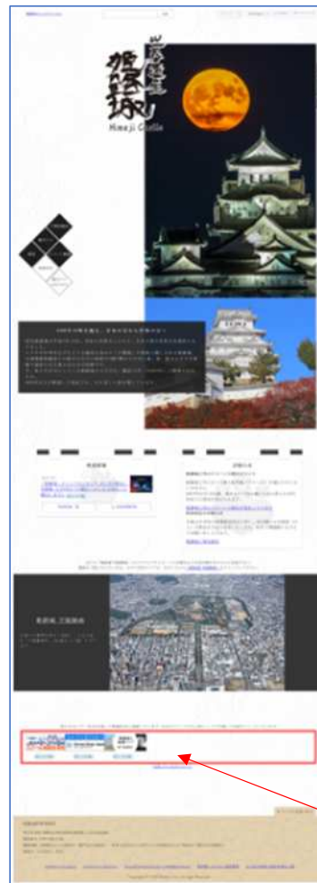
B「姫路城公式サイト」の掲載イメージ 10枠<赤枠部分>